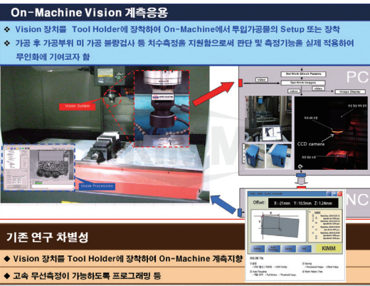
〈 변경소재 XYZ 3축 자율비전인식 빌트인 시스템 〉