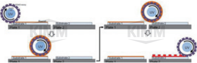
〈 공정 개략도 〉