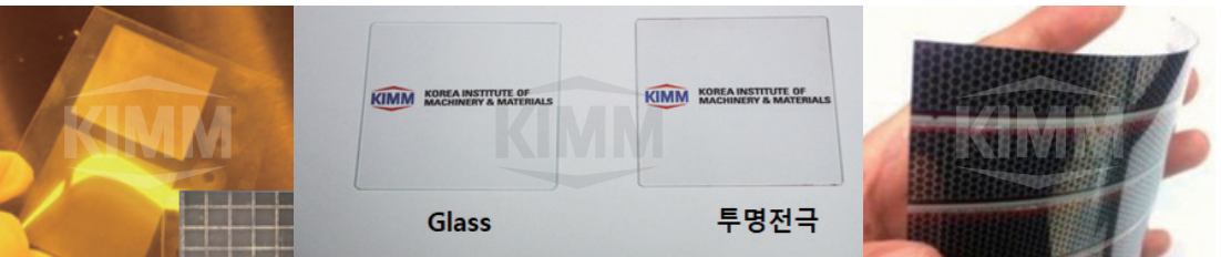
투명전극 제작 결과/투명전극필름/유연유기태양전지(응용)