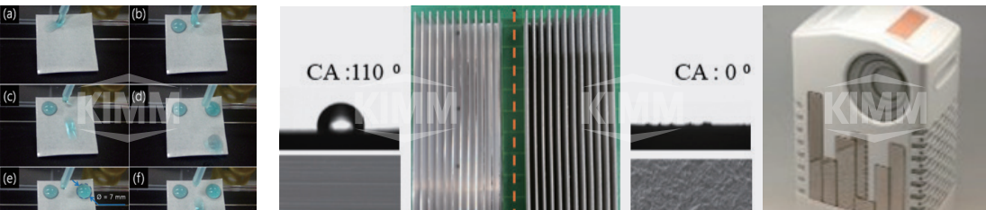
〈 친수성 패턴을 가지는 발수성 표면 〉