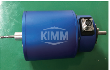
〈 밀링용 진동자 〉