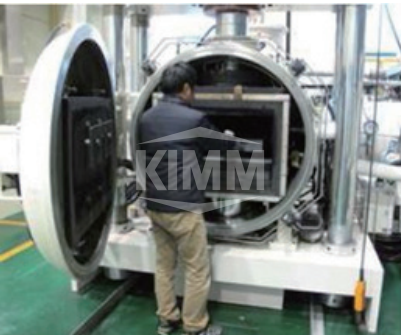
〈 Diffusion Bonding 진공접합로 〉