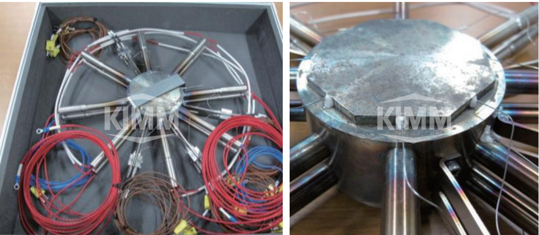
〈 열유속 측정기 〉