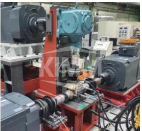
수직축 경량 기어박스 시험장치