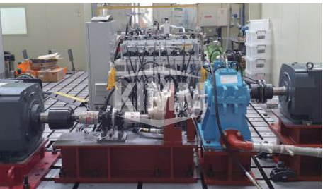
고속 경량 기어박스 및 윤활/냉각 시험장치