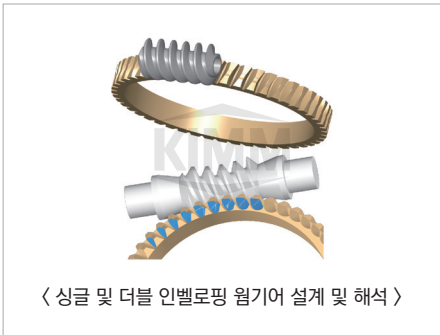
〈싱글 및 더블 인벨로핑 웜기어 설계 및 해석〉