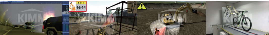
〈 특수이동체/탑승체의 가상이동지원 시뮬레이터 기술 〉