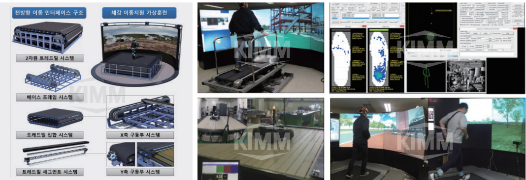
〈 휴먼 인터페이스 시제품 〉