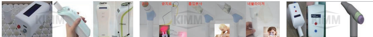
〈 호기속도/가스복합분석장치 〉