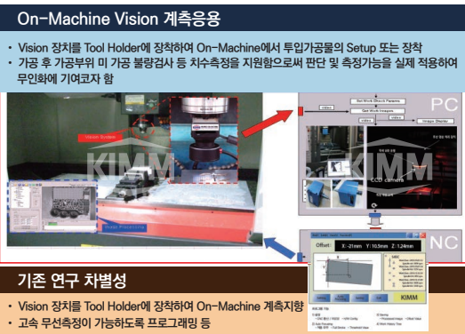
〈 변경소재 XYZ 3축 자율비전인식 빌트인 시스템 〉