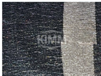
〈 Step&scanning 방식의 이음매 문제점 〉