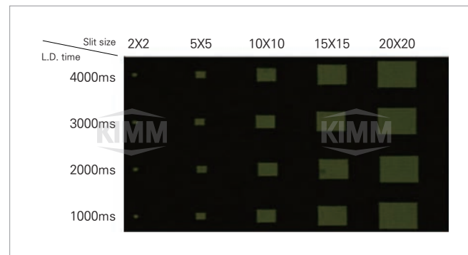
〈 슬릿 가공의(예) 〉