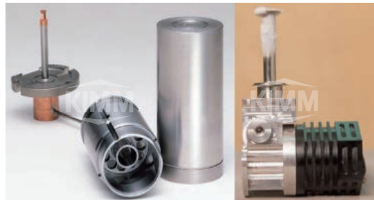
〈 센서 냉각용 스테링 극저온 냉동기 〉