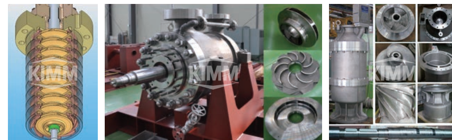
〈 화학발전용 수직배열형 10단 펌프 〉