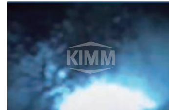
〈미분기내 화재발생 순간 영상〉