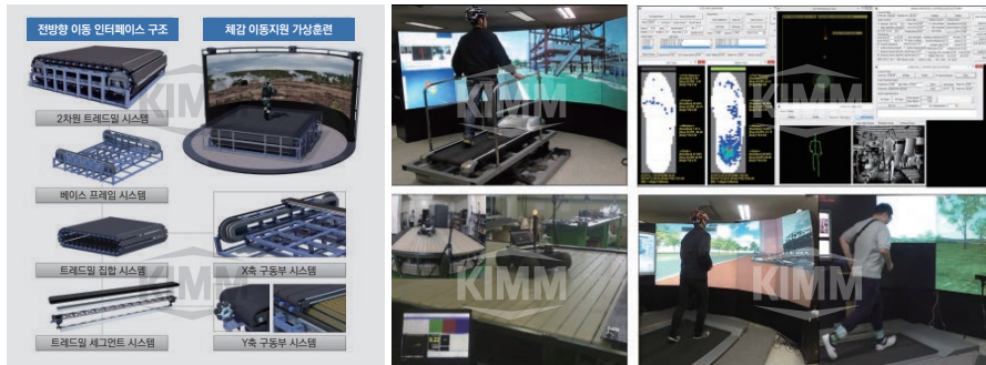
〈 휴먼 인터페이스 시제품 〉