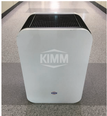
〈 공기청정기 실물사진 〉