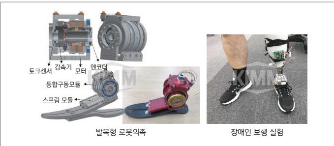
〈 개발된 발목형 로봇의족 및 장애인 보행실험 〉