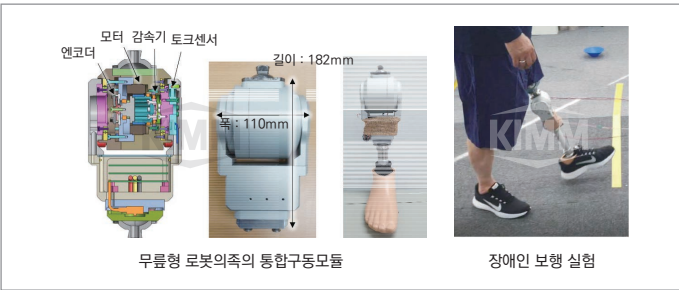
〈 개발된 무릎형 로봇의족 및 장애인 보행실험 〉