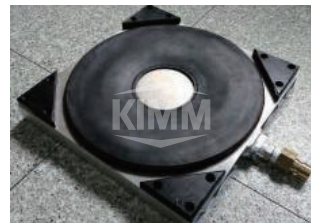
〈 에어쿠션 유닛 〉

○○○○○○○○○○○○○○○○○○○○ 설계 · 제작된 에어쿠션 이송장치 시제품 ○○○○○○○○○○○○○○○○○○○○○○