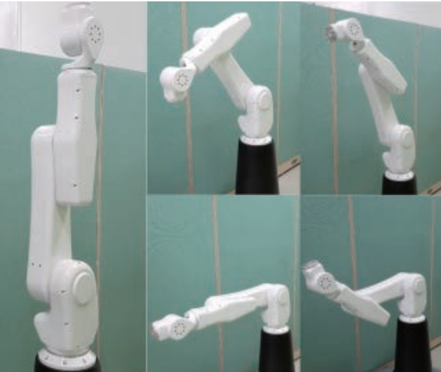
〈자중보상 로봇 매니퓰레이터(eZRo)〉