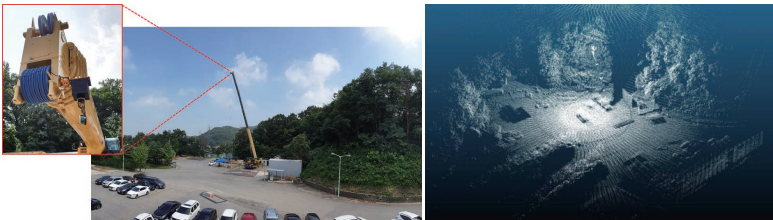
〈크레인 3차원 충돌 안전제어 실험(좌), 환경 인식 결과(우)〉