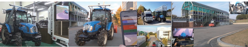
〈실차량 기반 가상주행시험, 휴대단말기 및 WIFI기반 원격 통제 기술〉