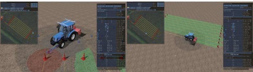
〈삼차원 기반 트랙터 무인운용 가상시험 및 작업경로 가시화 기술〉