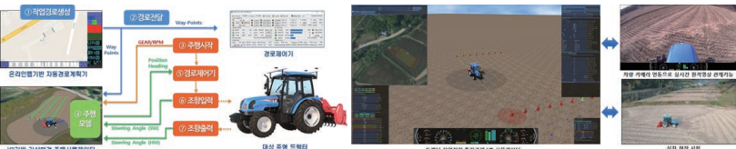
〈농업용 트랙터 가상시험 및 원격운용 개념〉